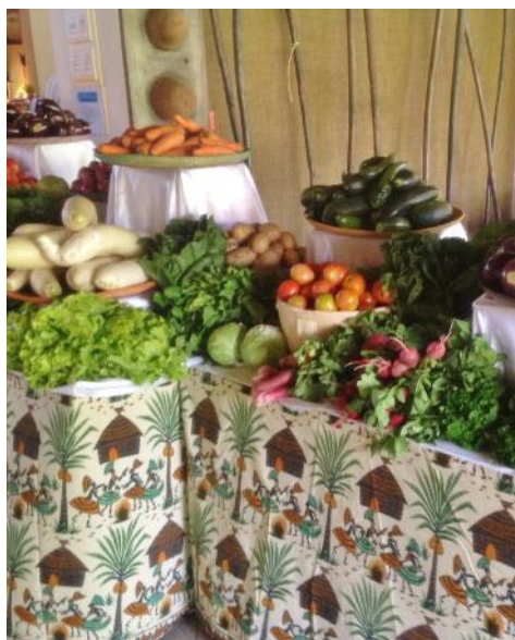
Buffet avec les produits des jardins