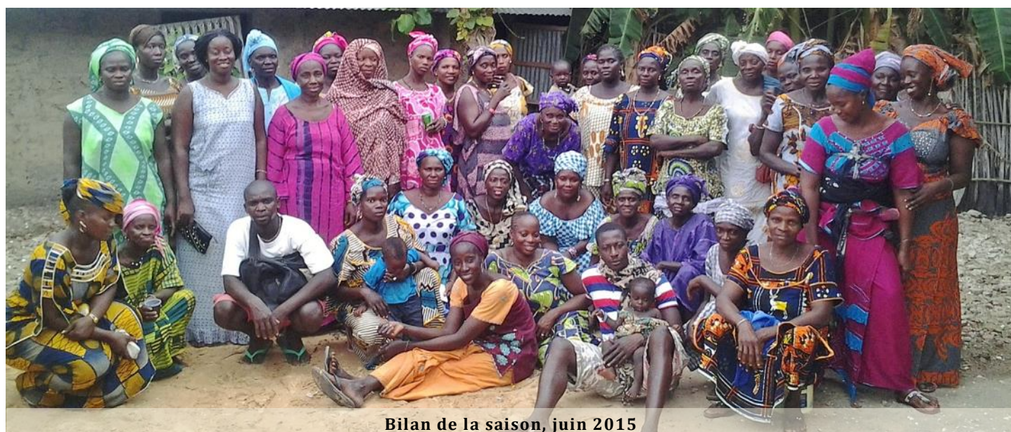
Bilan de la saison, juin 2015