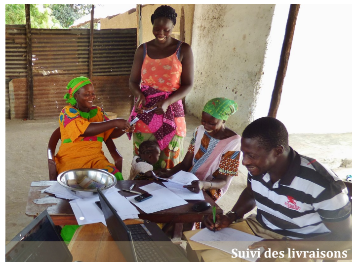
Suivi des livraisons