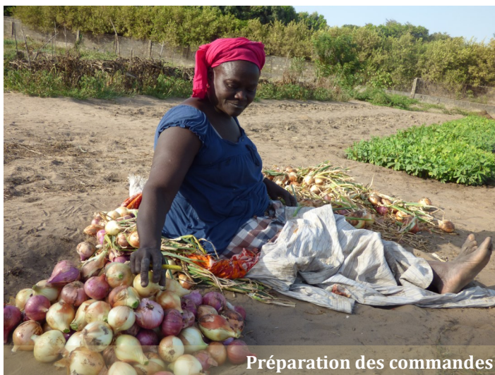
Préparation des commandes

Recettes de livraisons 11 831 700 Fcfa Soit un peu plus de 18 k€